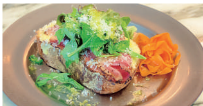
PASTRAMI TOAST ¥1,430 パストラミトースト