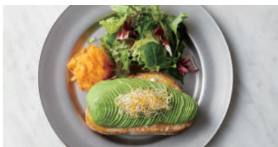
AVOCADO TOAST ¥1,320 アボカドトースト