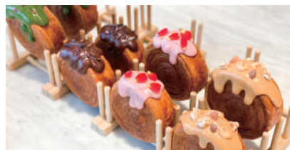
NY CROISSANT ¥1,000 ニューヨーククロワッサン